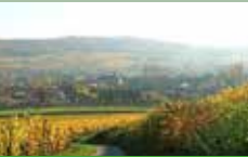
Altenberg de Bergbieten