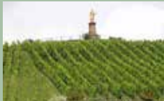
Altenberg de Wolxheim